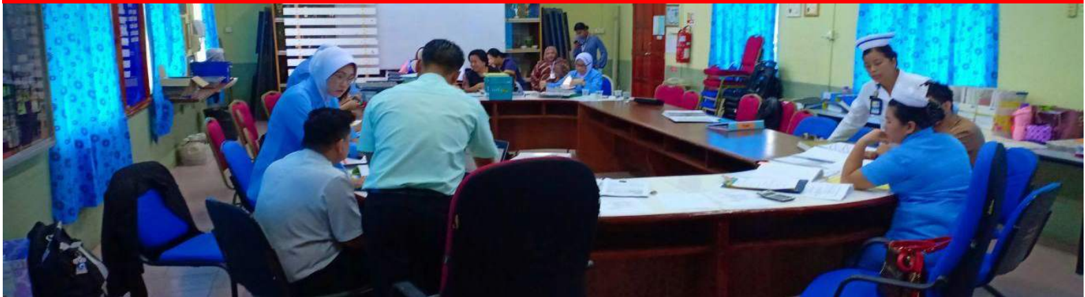
EXTERNAL AUDIT HPIA DARI HOSPITAL TENOM (25HB JULAI 2019)