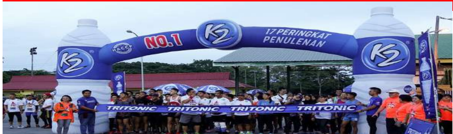
BORNEO HEALTH RUN 2019 PBU (30 JUN 2019)