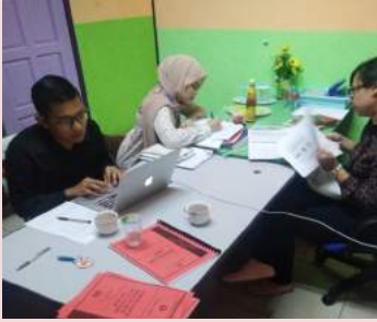
Semakan Pematuhan Dokumentasi Dan Manual GMP HACCP