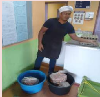
Proses Audit Penerimaan Bahan Mentol Mematuhi SOP