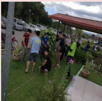
Gotong Royong Taman Terapeutik