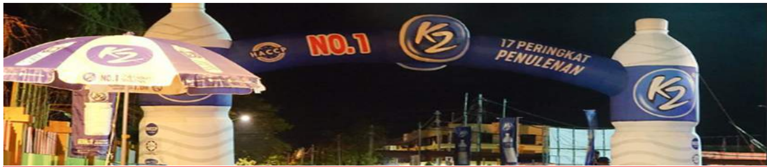
BORNEO HEALTH RUN 2019 PBU (30 JUN 2019)