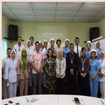
Majlis Penutupan Audit Pensijilan