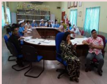
Majlis Penutupan Audit Pensijilan