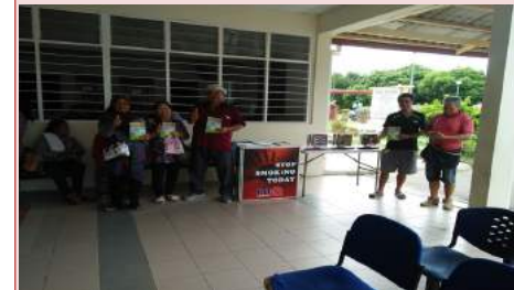
Pameran Poster Bahaya Rokok & Edaran Bacaan Risalah