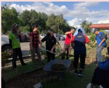
Gotong Royong Taman Terapeutik