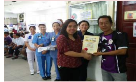
Penyampaian Sijil Penghargaan Kepada Klien Yang Berjaya Berhenti Merokok