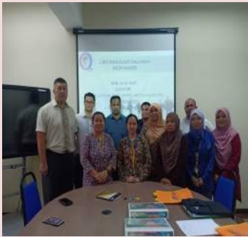
Audit Kolej Komuniti Kota Marudu