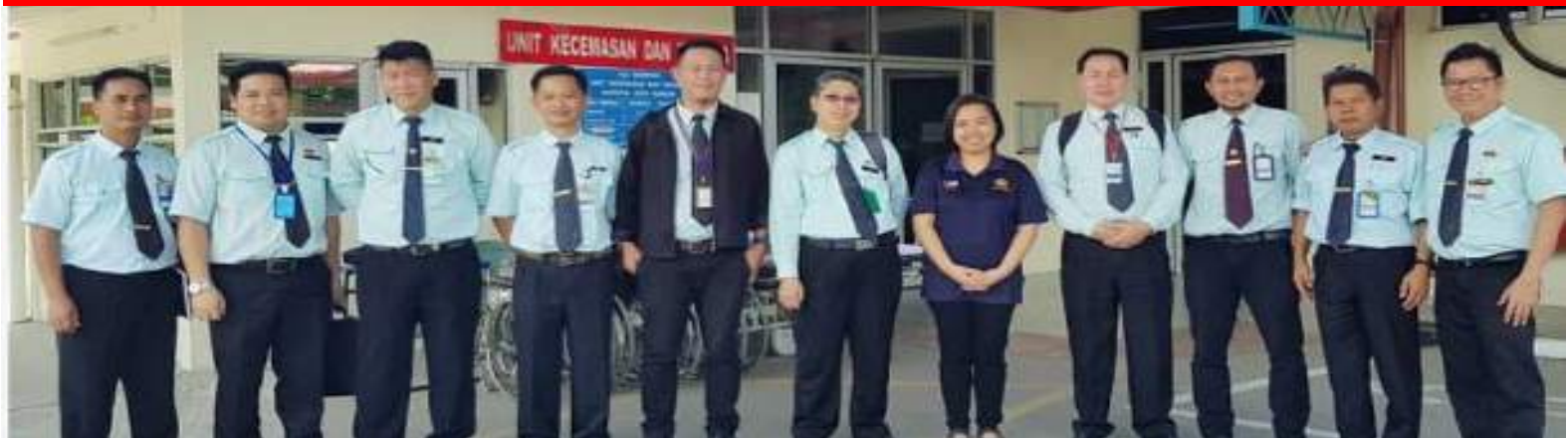
ROMBONGAN AUDITOR PPP KE HKM (2HB OGOS 2019)