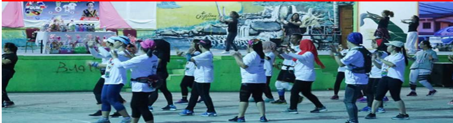
BORNEO HEALTH RUN 2019 PBU (30 JUN 2019)