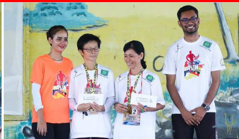
BORNEO HEALTH RUN 2019 PBU (30 JUN 2019)