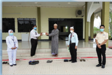
Penyerahan Sumbangan Amal HTrn ke Rumah Anak Yatim HOME Tuaran 20 Mei 2020