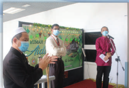
Majlis Sambutan Hari Raya Hospital Tuaran 19 Jun 2020