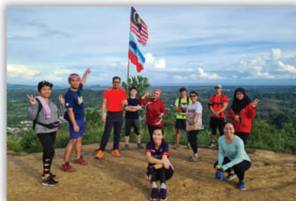
Aktiviti Daki Bukit Ruhiang bersama TPKN (Perubatan) Sabah 27 Jun 2020