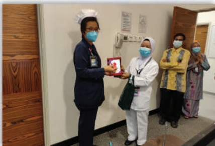
Majlis Penghargaan kepada PJ Flora Asing 14 Mei 2020