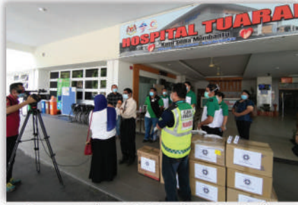
Penyerahan PPE oleh St. John kepada Hospital Tuaran 15 Mei 2020