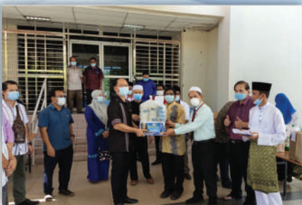
Menerima Sumbangan Bubur Lambuk daripada TKM Sabah 14 Mei 2020