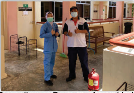
Pemeriksaan Bersama Agensi Lain Persediaan Pusat Kuarantin Tuaran 14 April 2020