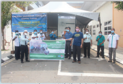
Penyerahan Kubikel Saringan Covid 19 22 April 2020