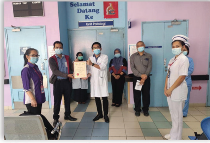
Benchmark Akreditasi Standard 15 & 16 ke Hosp. Kuala Penyu 12 Ogos 2020