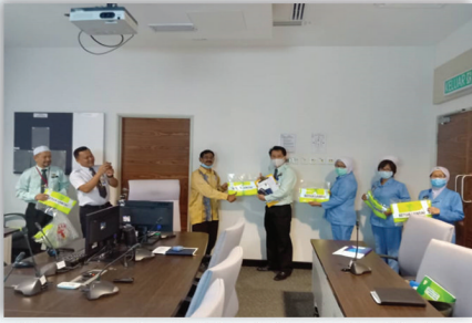
Penyerahan Vest kepada Ketua Lantai Keselamatan Kebakaran 03 Julai 2020