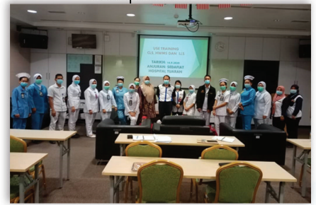
User Training CLS, HWMS, LLS 14 September 2020