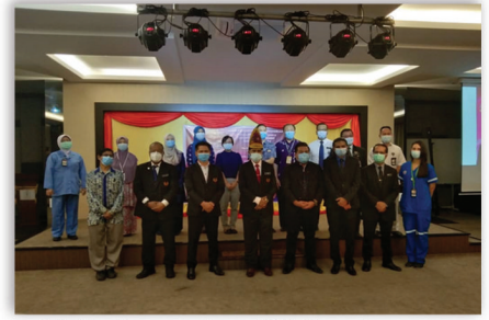
Majlis Penyerahan Sijil Penghargaan CEUPACS kepada Petugas Barisan Hadapan Covid-19 10 September 2020