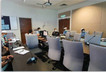
Mesyuarat Pelaksanaan Pink Alert bersama PDRM Tuaran 12 Ogos 2020