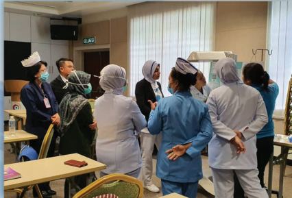
Bengkel Refresher NRP 18 Ogos 2020