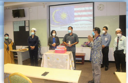
Perhimpunan Pagi September 17 September 2020