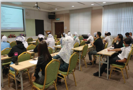
Bengkel Pain Free 05 Ogos 2020