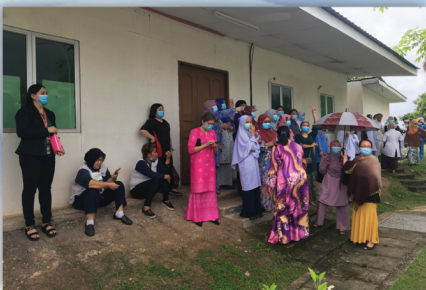
Latihan Pengungsian Bangunan 28 Julai 2020