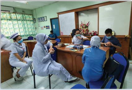
Kursus 20 Jam Penyusunan Susu Ibu 27 Julai 2020