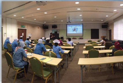
Kursus Budaya Baru Susulan COVID 19 19 Ogos 2020