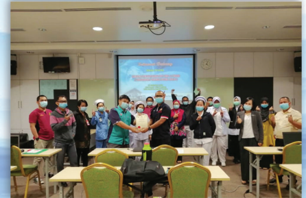
Bengkel Pemantapan ICT (Microsoft Excel) 15 September 2020