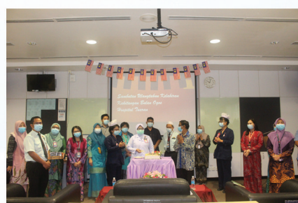
Perhimpunan Pagi Ogos 27 Ogos 2020