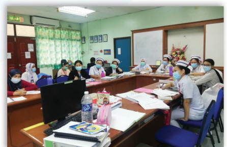
Mesyuarat Link Nurse Kawalan Infeksi 22 September 2020

The reward for work well done is the opportunity to do more.