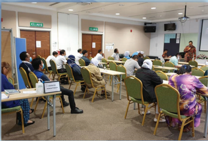
Kursus Keselamatan Kebakaran 28 Julai 2020