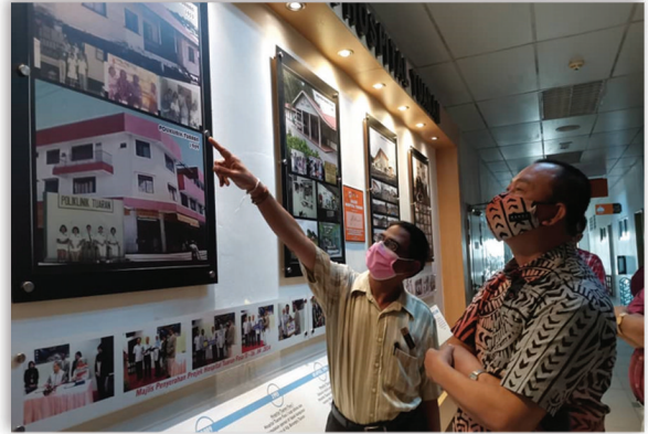
Lawatan dan Penyerahan Sumbangan daripada Menteri Pembangunan Luar Bandar Sabah 20 Disember 2020