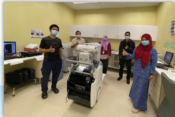
Mesin Digital Direct Radiography (DDR) sumbangan YAB Ketua Menteri Sabah 21 Disember 2020