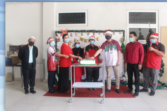
Sambutan Hari Krismas Hospital Tuaran 22 Disember 2020