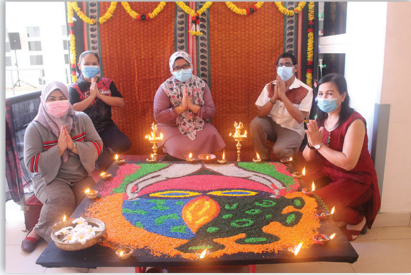
Sambutan Hari Deepavali 14 November 2020