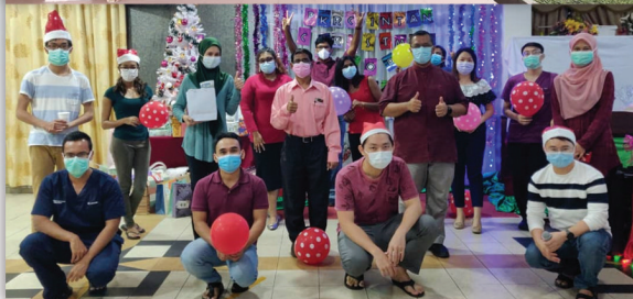
Sambutan Hari Krismas PKRC Tuaran RELA: 18 Disember 2020 INTAN : 22 Disember 2020