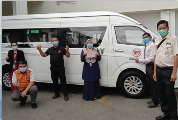
Penerimaan Kenderaan Baharu Jabatan 20 November 2020