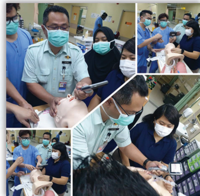
Latihan Video Assisted Laryngoscope 23 Disember 2020

If you can't describe what you are doing as a process, you don't know what you're doing. W. Edwards Deming