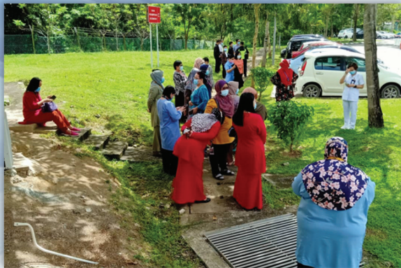
Latihan Pengungsian Bangunan (Firedrill) 24 November 2020