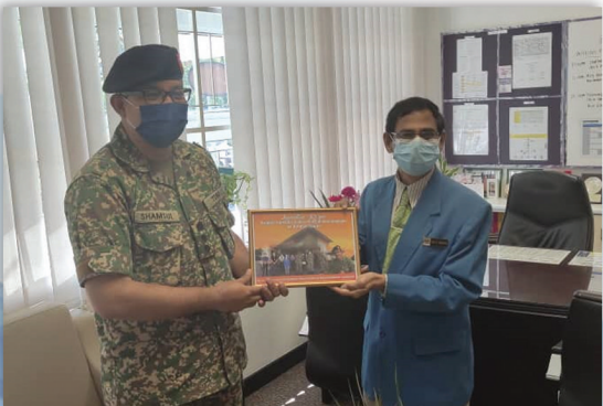
Lawatan daripada Hospital Angkatan Tentera Wilayah KK 04 Ogos 2021