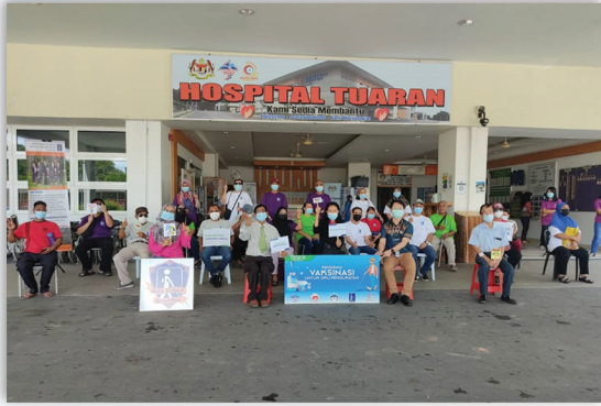
Pemberian Vaksin kepada Persatuan Orang Buta Sabah (Tuaran) 14 Julai 2021