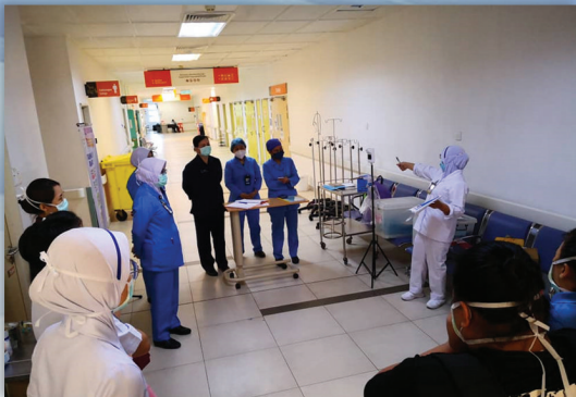
Perbincangan persediaan Pembukaan Wad Covid-19 Hospital Tuaran 05 Ogos 2021