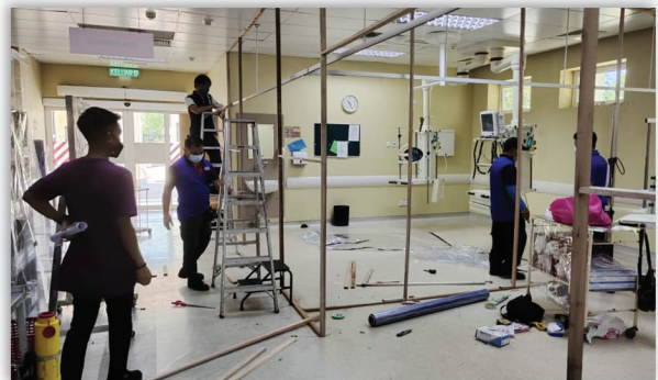
Tambahbaik Jabatan Kecemasan bagi Rawatan pesakit Covid-19 24 September 2021