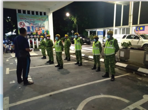
Taklimat kepada RELA sebagai Kawalan Keselamatan Hospital 1 September 2021