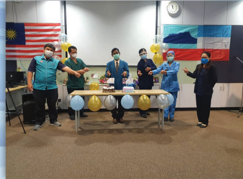
Sambutan Ulangtahun ke-5 Hospital Tuaran Fasa II 17 September 2021