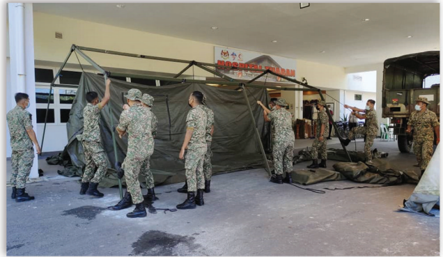
Pemasangan Khemah bagi Rawatan Jabatan Kecemasan 27 Ogos 2021