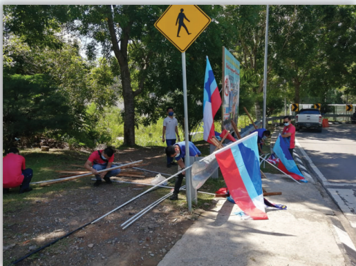
Pemasangan bendera sempena Bulan Kebangsaan 18 Ogos 2021