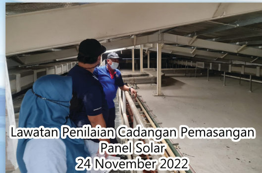
Lawatan Penilaian Cadangan Pemasangan Panel Solar 24 November 2022