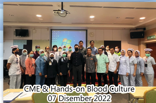
CME & Hands-on Blood Culture 07 Disember 2022