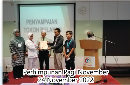
Perhimpunan Pagi November 24 November 2022