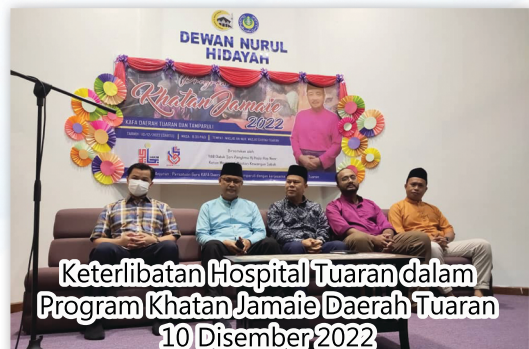
Keterlibatan Hospital Tuaran dalam Program Khatan Jamaie Daerah Tuaran 10 Disember 2022