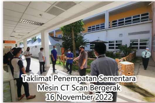
Taklimat Penempatan Sementara Mesin CT Scan Bergerak 16 November 2022