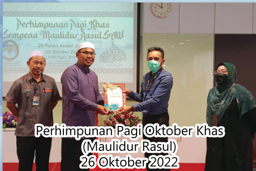
Perhimpunan Pagi @Oktober Khas (Maulidur Rasul) 26 Oktober 2022