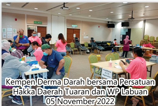
Kempen Derma Darah bersama Persatuan Hakka Daerah Tuaran dan WP Labuan 05 November 2022