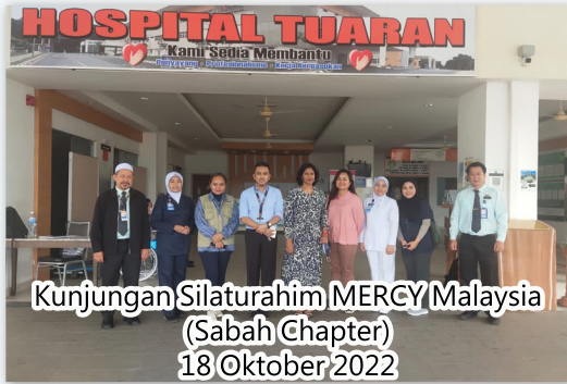
Kunjungan Silaturahmi MERCY Malaysia (Sabah Chapter) 18 Oktober 2022