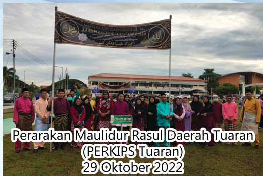
Perarakan Maulidur Rasul Daerah Tuaran (PERKIPS Tuaran) 29 Oktober 2022