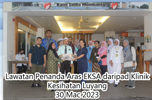
Lawatan Penanda Aras EKSAs daripada Klinik Kesihatan Luyang 30 Mac 2023