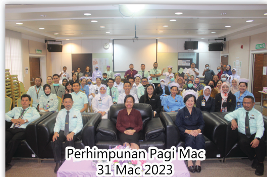
Perhimpunan Pagi Mac 31 Mac 2023