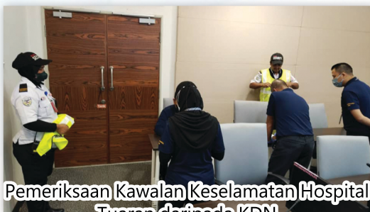
Pemeriksaan Kawalan Keselamatan Hospital Tuaran daripada KDN 09 Februari 2023