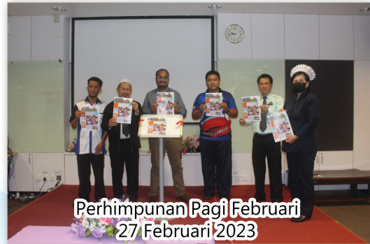
Perhimpunan Pagi Februari 27 Februari 2023