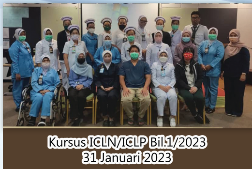
Kursus ICLN/ICLP Bil.1/2023 31 Januari 2023