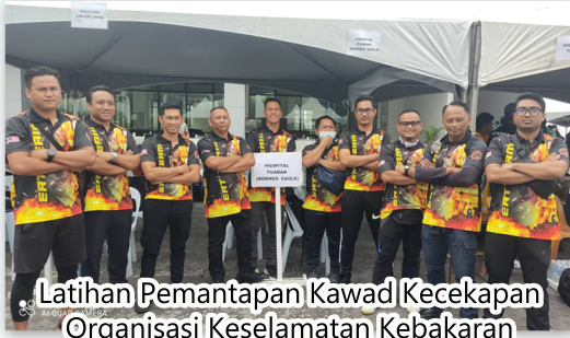
Latihan Pemantapan Kawad Kecekapan Organisasi Keselamatan Kebakaran 09 Januari 2023