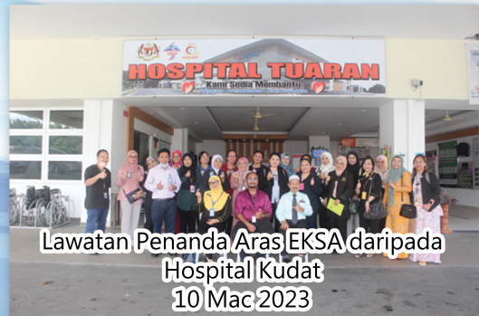
Lawatan Penanda Aras EKSAs daripada Hospital Kudat 10 Mac 2023