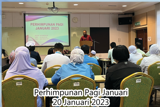
Perhimpunan Pagi Januari 20 Januari 2023