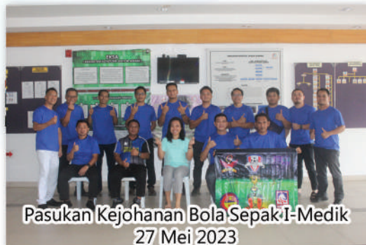
Pasukan Kejohanan Bola Sepak I-Medik 27 Mei 2023