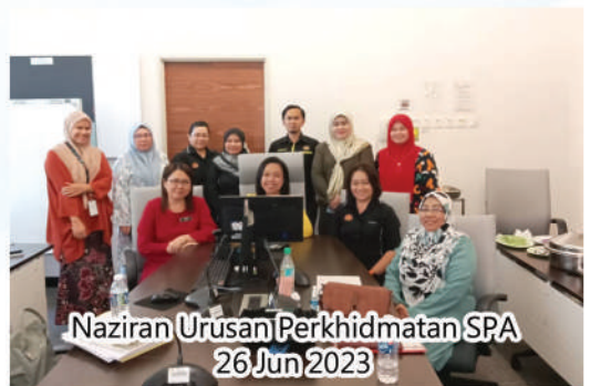
Naziran Urusan Perkhidmatan SPA 26 Jun 2023