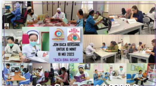
Jom Baca Bersama untuk 10 Minit 18 Mei 2023