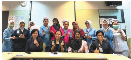
Mesyuarat Baby Friendly Hospital Initiative bersama PKK Tuaran dan AKKSI Tuaran 14 Jun 2023