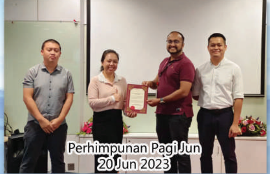
Perhimpunan Pagi Jun 20 Jun 2023