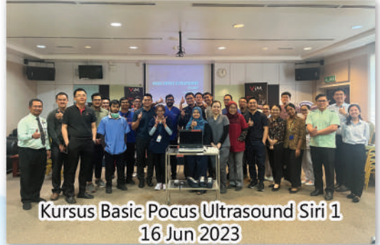
Kursus Basic Pocus Ultrasound Siri 1 16 Jun 2023