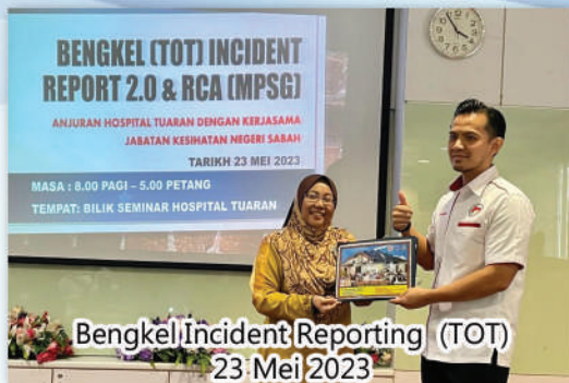
Bengkel Incident Reporting (TOT) 23 Mei 2023