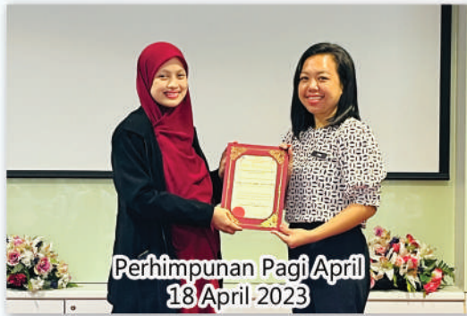
Perhimpunan Pagi April 18 April 2023