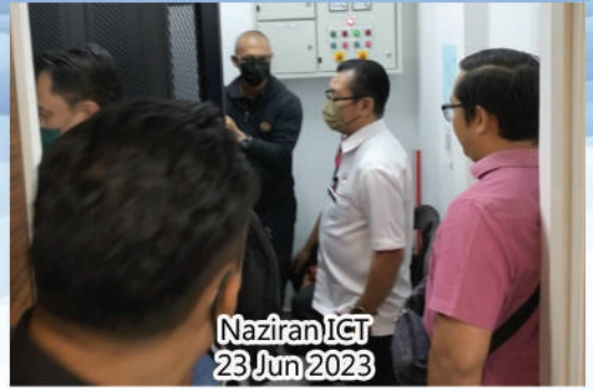
Naziran ICT 23 Jun 2023