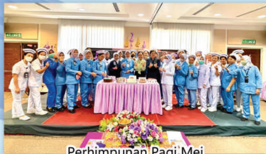
Perhimpunan Pagi Mei 22 Mei 2023