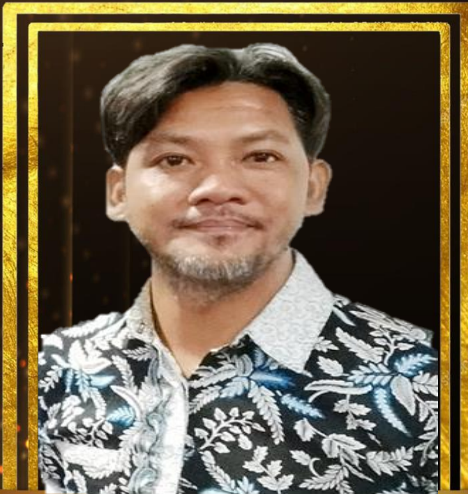
RAIS BIN RASHD PEMANDUKENDERAAN H1/H4