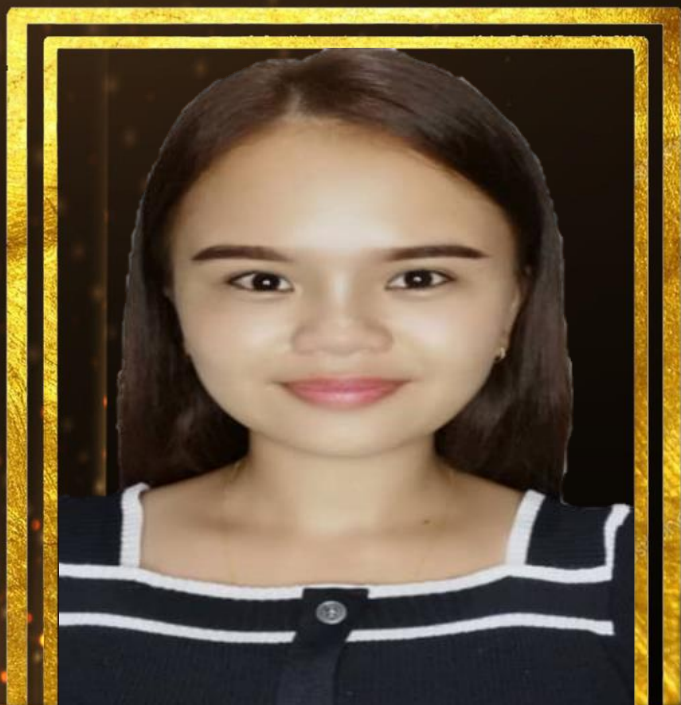
CHRISMEFINA DAMANUS PEMBANTUAWAMH1