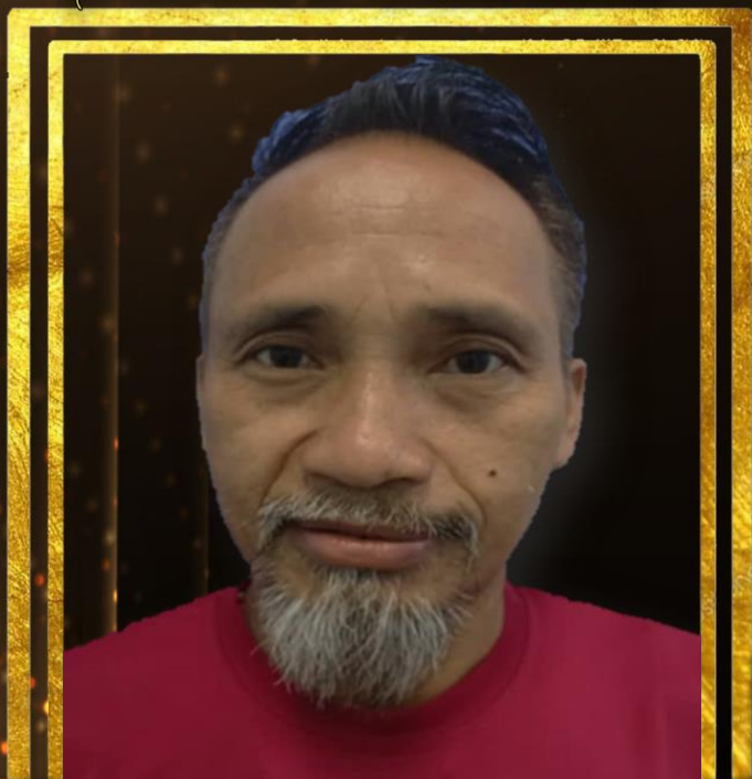
BINJUL BINBALADUS PEMBANTU PERAWATAN KESIHATAN H1