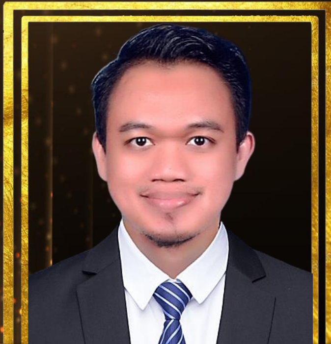
DR. MOHAMAD ZIKRI BIN MOHAMAD JUNAIDI HOSPITAL BELLURAN UD48