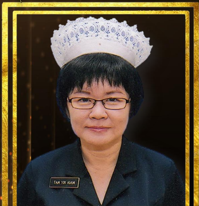
TANYIKIAM PENYELIA JURURAWAT U36