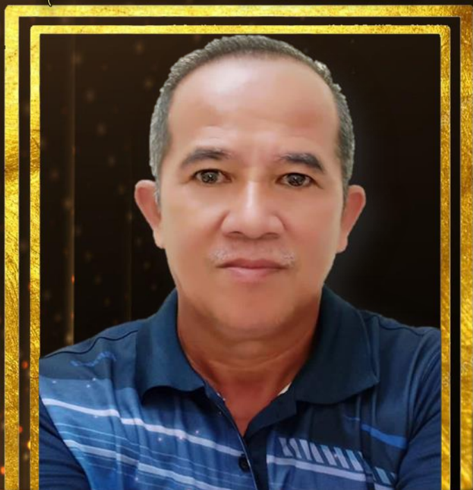
JUSNHBINNASIR PEMBANTUTADBIR (KEW) W26