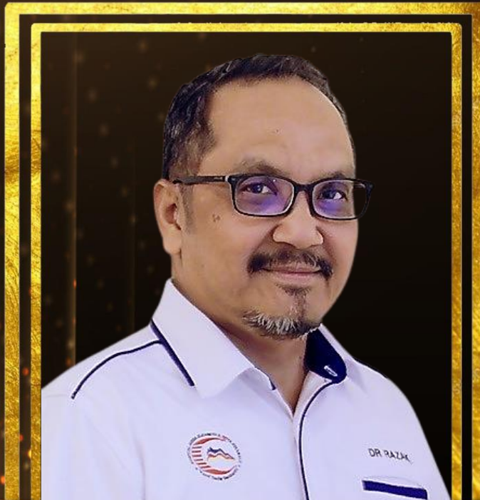
DR HJ. RAZAK BINTAMBI HOSPITAL QUEEN ELIZABETH III UD54