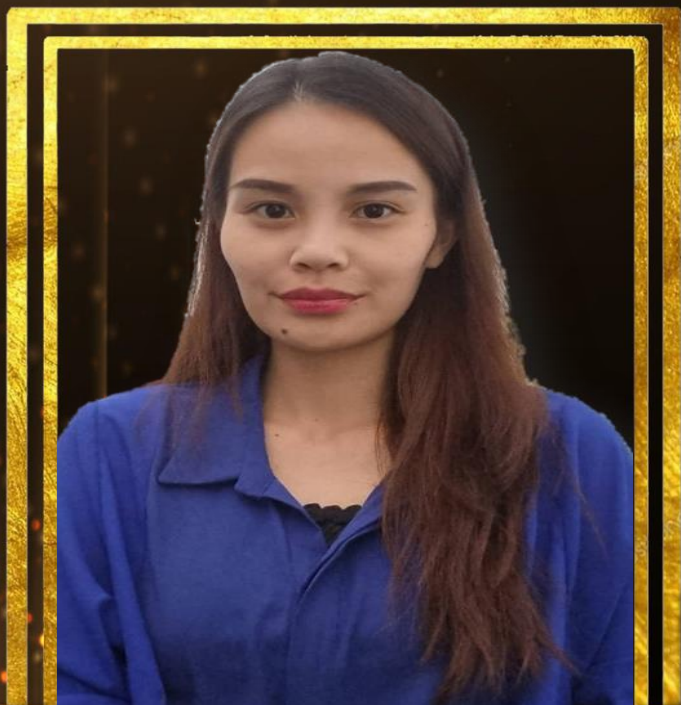
PRELLNANTHY PETER PEGAWAI TADBIR DAN DIPLOMATIK M41