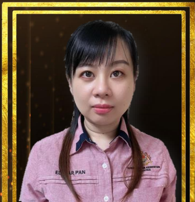
ELSCAR PANSHAUFUNG PEGAWAI TEKNOLOGI MAKANAN C44