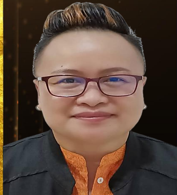
DR. LOLY MEALONNY GEOFFREY HOSPITAL KENINGAUUD54