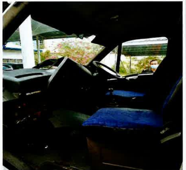
AMBULANS /DAILY CITY 35S13V IVECO (WLX 1042)