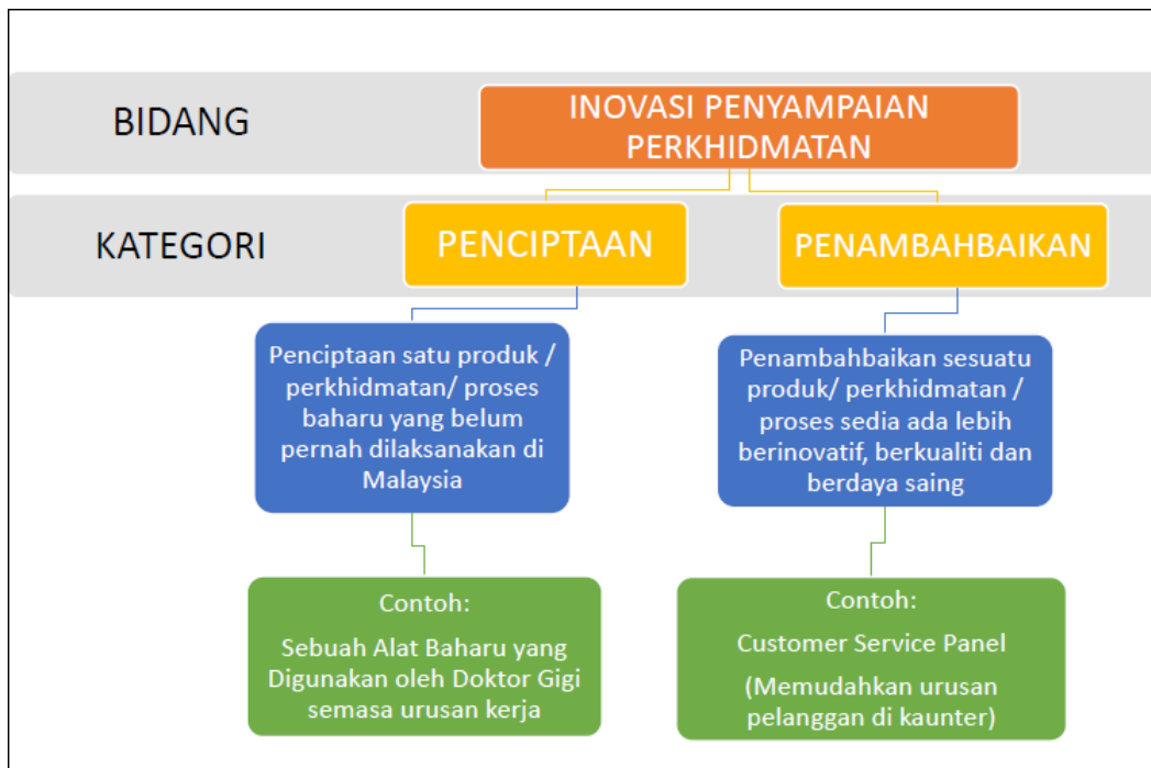
Rajah 2: Kategori bagi Bidang Inovasi Penyampaian Perkhidmatan dan Contoh Projek Yang Dihasilkan