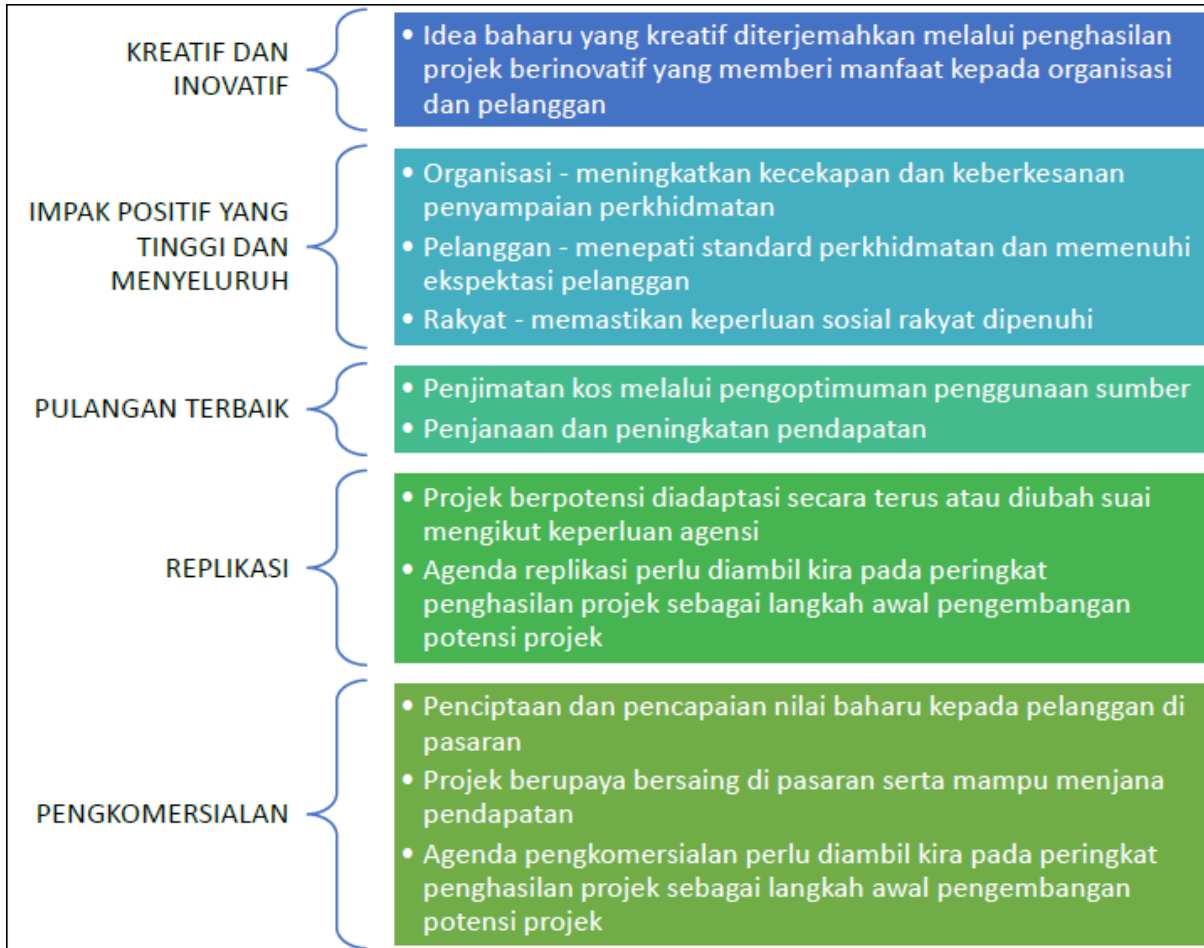
Rajah 3: Kriteria Penghasilan Projek yang Berpotensi untuk dikembangkan

Lima (5) kriteria yang perlu diambil kira oleh KIK di peringkat awal penghasilan projek bagi memastikan projek yang dipilih berjaya dilaksanakan dan seterusnya berpotensi untuk dikembangkan.