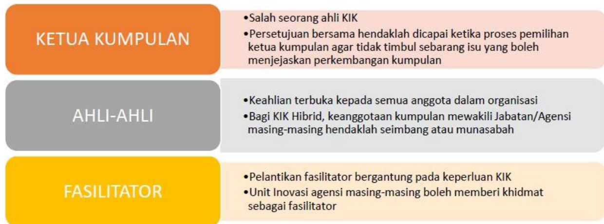
Rajah 4: Komponen KIK