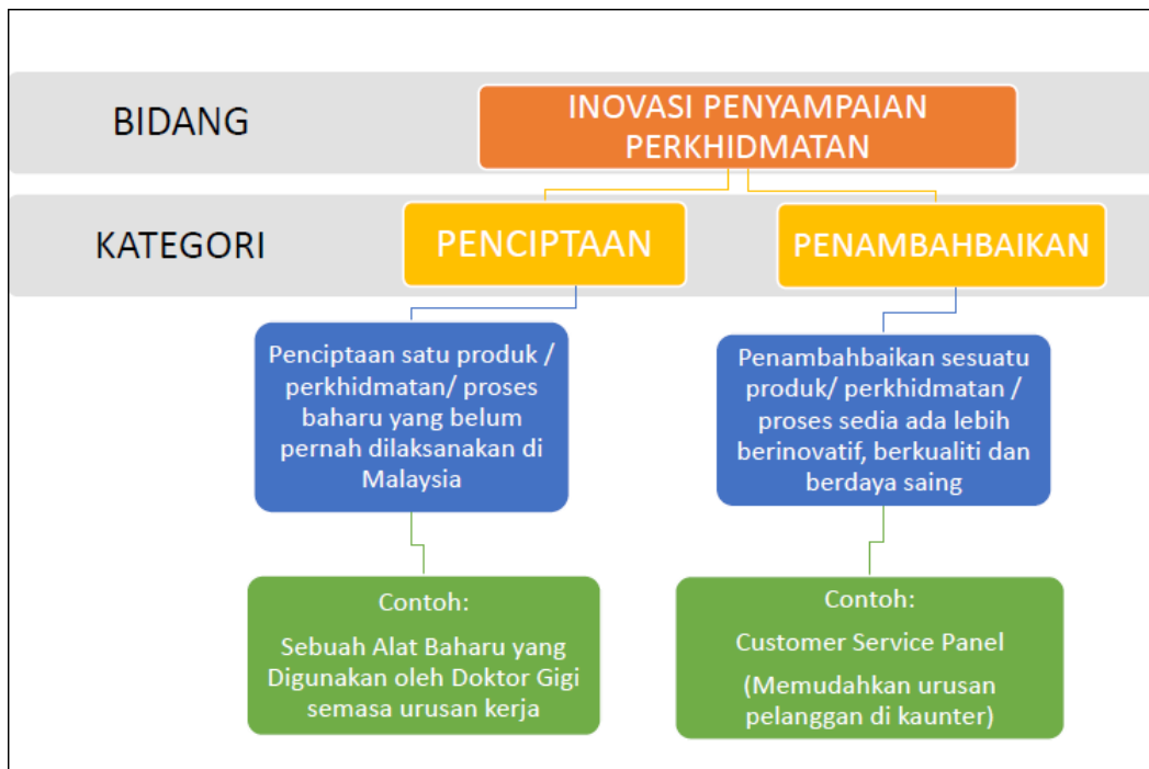
Rajah 2: Kategori bagi Bidang Inovasi Penyampaian Perkhidmatan dan Contoh Projek Yang Dihasilkan